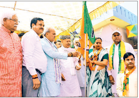
रेवाड़ी। कार्यक्रम में पार्टी का झंडा लगाते हुए केंद्रीय मंत्री व अन्य तथा मौजूद भाजपा कार्यकर्ता।

केंद्रीय मंत्री राव इन्द्रजीत सिंह ने कहा कि आज भाजपा विश्व का सबसे बड़ा राजनीतिक दल केवल सत्ता के कारण नहीं, बल्कि अपनी अंत्योदय की विचारधारा और सेवा भाव के कारण है। उन्होंने कहा कि स्थापना दिवस का असली उत्सव तभी सार्थक होगा जब हम अंतिम छोर पर बैठे व्यक्ति तक सरकार की नीतियों का लाभ पहुंचाएंगे। केंद्रीय मंत्री सोमवार को भारतीय जनता पार्टी के स्थापना दिवस पर आनंद नगर स्थित राजा वाटिका में गांव चलो-बस्ती चलो अभियान के अंतर्गत आयोजित कार्यक्रम में कार्यकर्ताओं को संबोधित कर रहे थे। इस मौके पर केंद्रीय मंत्री राव इन्द्रजीत सिंह ने मुख्य अतिथि के रूप में शिरकत कर कार्यकर्ताओं को संगठन की मजबूती का मंत्र