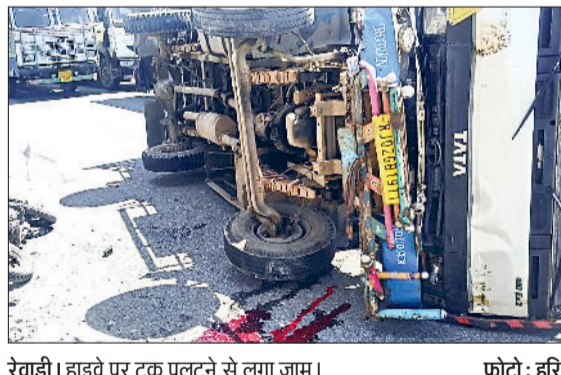
रेवाड़ी। हाइवे पर ट्रक पलटने से लगा जाम।