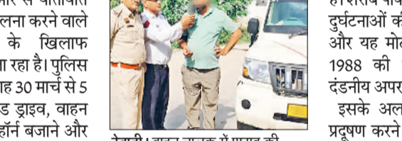
हरिभूमि न्यूज ▶▶ रेवाड़ी