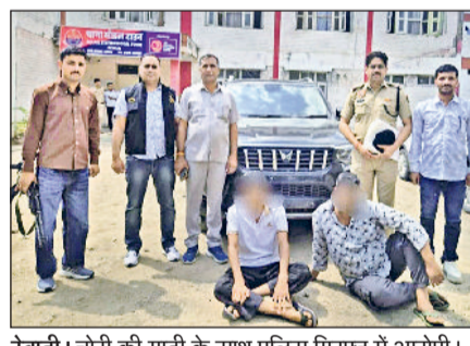
रेवाड़ी। चोरी की गाड़ी के साथ पुलिस गिरफ्त में आरोपी।