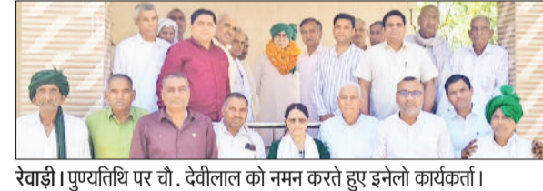
रेवाड़ी। पुण्यतिथि पर चौ. देवीलाल को नमन करते हुए इनेलो कार्यकर्ता।

इंडियन नेशनल लोकदल के कार्यकर्ताओं ने सोमवार को पूर्व उप-प्रधानमंत्री जननायक स्व. चौधरी देवीलाल की 25वीं पुण्यतिथि पर श्रद्धांजलि अर्पित की। उन्होंने बावल क्षेत्र के गांव बालावास जाट स्थित चौ. देवीलाल की प्रतिमा पर माल्यार्पण कर नमन किया। इस मौके पर इनेलो नेताओं ने कहा कि चौ. देवीलाल हमेशा गरीब, किसान और मजदूर वर्ग की आवाज बने रहे। उन्होंने अपना पूरा जीवन समाज के कमजोर वर्गों के उत्थान और उनके अधिकारों की रक्षा के