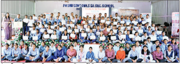
रेवाड़ी। बुनियाद परीक्षा में सफल विद्यार्थी शिक्षकों के साथ।