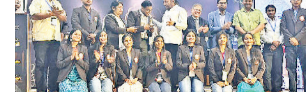
रेवाड़ी। हेदराबाद में आईजीयू की टीम को पुरस्कृत करते अतिथि।