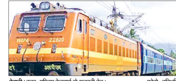
रेवाड़ी। उत्तर-पश्चिम रेलमार्ग से गुजरती ट्रेन।

प्रारंभिक स्टेशन से रेल सेवाएं आंशिक रद्द गाड़ी संख्या 22422 जोधपुर-दिल्ली सराय एक्सप्रेस ट्रेन 24 मई को जोधपुर के स्थान पर डेगाना से संचालित होगी। यह रेलसेवा जोधपुर-डेगाना के मध्य आंशिक रद्द रहेगी। गाड़ी संख्या 14721 जोधपुर-बठिण्डा एक्सप्रेस 24 मई को जोधपुर के स्थान पर बीकानेर से संचालित होगी। गाड़ी संख्या 14722 अबोहर-जोधपुर एक्सप्रेस ट्रेन 23 मई को अबोहर से प्रस्थान करके बीकानेर तक ही संचालित होगी। गाड़ी संख्या 22977 जयपुर-जोधपुर एक्सप्रेस रेलसेवा 24 मई को रद्द रहेगी। गाड़ी संख्या 22978 जोधपुर-जयपुर एक्सप्रेस रेलसेवा 24 मई को रद्द रहेगी।