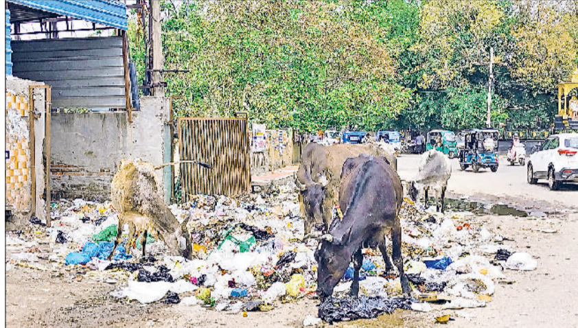
रेवाड़ी। अग्रसेन चौक स्थित कचरा डंपिंग स्टेशन खाली व बाहर डाला गया कचरा।

जागरूक करना भी टेढ़ी खीर हो गया है। सभी वाडों में सुचारू रूप से कचरे का उठान नहीं किया जा रहा है। यहां तक कि सरकुलर रोड पर ही कई अनावश्यक कचरा प्वाइंट बन गए हैं। डंपिंग स्टेशनों का कचरा सड़क पर फैल रहा है। शहर की सड़कों पर रखे गए प्लास्टिक के डस्टबिनों के पास ही कचरा प्वाइंट बन गए हैं। डस्टबिनों के भर जाने पर सफाई न होने के कारण लोग सड़क पर कचरा डाल रहे हैं। नगर परिषद की ओर से शहर में 200 से अधिक डस्टबिन पाकों व मुख्य सड़कों पर रखे गए हैं ताकि सफाई व्यवस्था में सुधार हो सके, लेकिन इन डस्टबिनों के पास ही सड़क पर कचरा फैल रहा है।