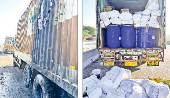
रेवाड़ी। हाइवे पर आग लगने से जला ट्रक का एक हिस्सा और ट्रक से उताए गए केमिकल के ड्रम।

दिल्ली-जयपुर नेशनल हाइवे पर रविवार की रात मुंबई से गाजियाबाद जा रहे केमिकल ड्रम व बैग से भरे ट्रक में आग लग गई। ट्रक के बाहरी हिस्से में लगी आग अंदर तक नहीं पहुंची, जिससे बड़ा हादसा होने से टल गया। इस दौरान हाइवे के एक हिस्से पर यातायात बाधित रहा। मुंबई से केमिकल के ड्रम व बैग भरकर चला एक ट्रक रात को खेड़ा बार्डर पार करके निकला तो उसके बीच के हिस्से में टायरों के पास से