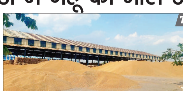
रेवाड़ी। कोसली अनाज मंडी में लगी गेहूं की ढेरी।