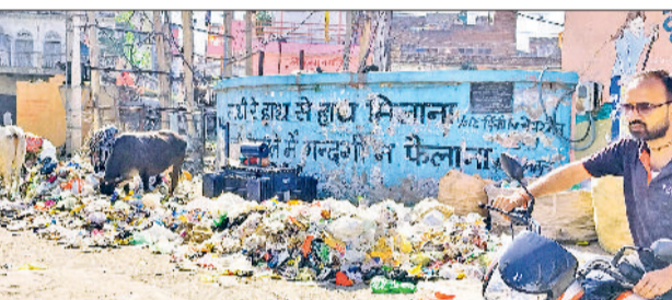
रेवाड़ी। गोल चक्कर मोहल्ले में दीवार पर लिखा स्वच्छता स्लोगन व नीचे लगा कचरे का ढेर।