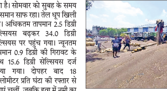
रेवाड़ी। अनाजमंडी में सरसों सुखाते हुए मजदूर।

पश्चिमी विक्षोभ की सक्रियता के चलते मंगलवार को एक बार फिर से मौसम में बदलाव आने की संभावना है। तेज आंधी के साथ हल्की बारिश का अनुमान लगाया जा रहा है। बारिश के साथ ओलावृष्टि से भी इनकार नहीं किया जा रहा है। मौसम को देखते हुए मार्केट कमेटी ने 7 अप्रैल को फसलों की खरीद नहीं करने का निर्णय लिया है। किसानों को इस दिन मंडी में फसल नहीं लाने की सलाह दी गई है। मौसम विभाग की ओर से मंगलवार को आंधी के साथ बारिश का अलर्ट जारी किया